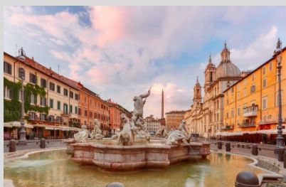
I sotterranei di Piazza Navona

Apertura esclusiva per ammirare da vicino il suo mosaico absidale.